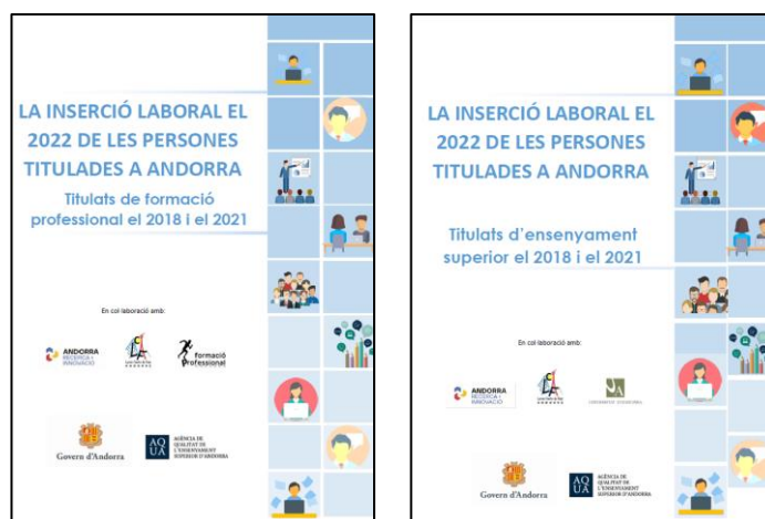
Figura 1. Portada dels estudis d'inserció laboral presentats el 2023.

El 2023 s'han acabat i presentat els estudis corresponents a les promocions d'ensenyament superior i de formació professional titulades el 2018 i el 2021 (vegeu la Figura 1). Els estudis estan disponibles als webs de l'AQUA i del Ministeri de Relacions Institucionals, Educació i Universitats.