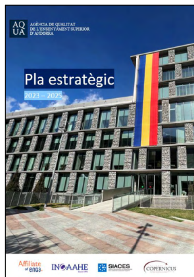
Figura 2. Portada del Pla estratègic 2023-2025 de l'AQUA.

El juliol de 2023 el Comitè Director de l'AQUA va aprovar el primer Pla estratègic de l'Agència per als pròxims dos anys (2023-2025). Aquest document, que es pot trobar al web de l'AQUA, va ser redactat per l'equip de l'Agència i va tenir en compte les opinions de tots els agents d'interès del sistema d'ensenyament superior d'Andorra, a més de disposar de la participació de diferents experts en l'assegurament de la qualitat en l'ensenyament superior.